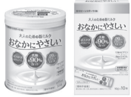
▲缶タイプとスティックタイプの2種類用意

雪印メグミルクグループで離乳食や機能性食品などの販売をしている雪印ビーンスターク(東京都新宿区)は1日、「大人のための粉ミルクおなかにやさしい」を発売した。同製品はお湯や水で溶かして使用するものでほんのりと甘い粉ミルク味。乳糖を約90パーセントカットし、牛乳で腹痛を起こしやすい人にも飲みやすいという。